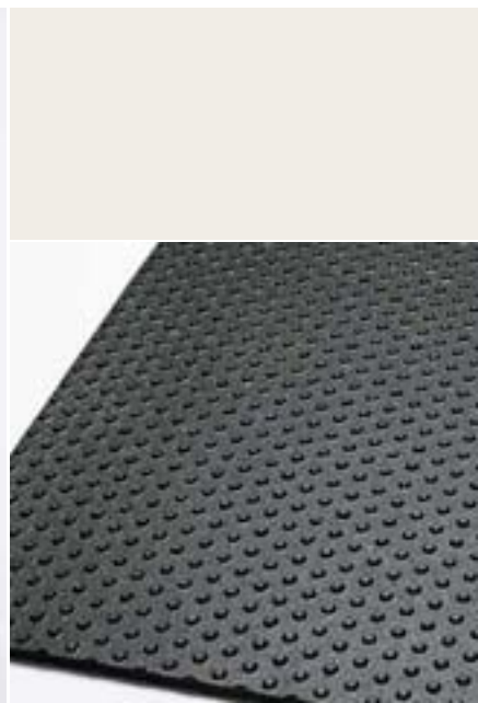
Onderzijde van de mat